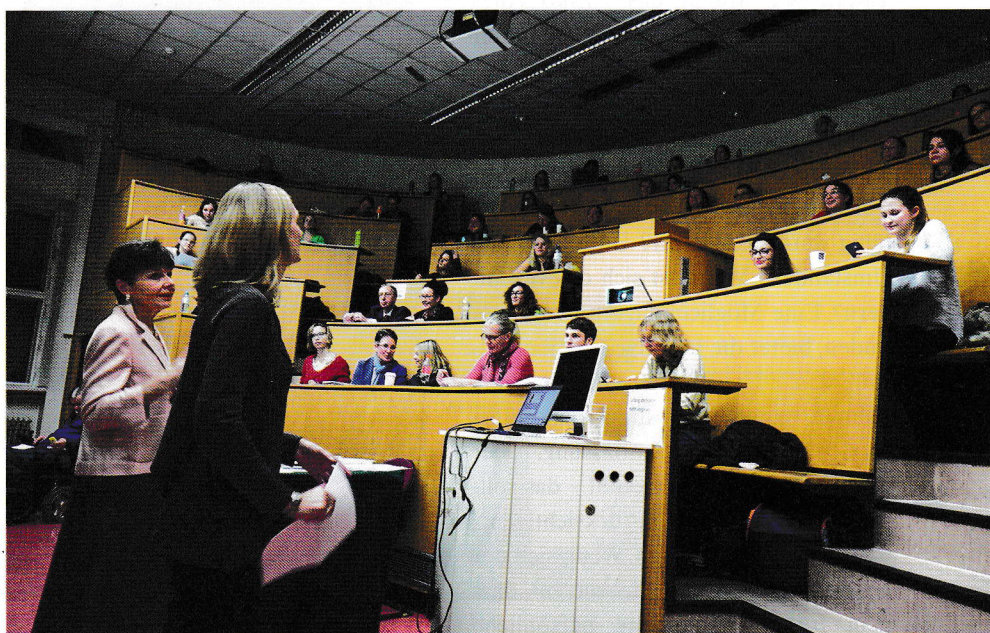
Ringvorlesung im Institut für Gerichtliche Medizin für Medizinstudenten und interessierte Gasthörer.