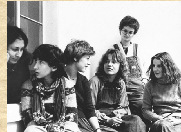
Gründerinnen des 1. Frauenhauses