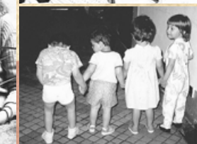
Kinder im Frauenhaus, 1989

1 Vor 35 Jahren setzten engagierte Studentinnen der damaligen Sozialakademie eine Projektidee in die Tat um: Sie gründeten das 1. Frauenhaus in Österreich. Obwohl der Widerstand groß war, gesetzliche Schutzbestimmungen wie das Gewaltschutzgesetz noch fern lagen und Gewalt an Frauen in der Familie ein Tabuthema in der Gesellschaft war, wurde das Angebot von Beginn an angenommen. Seither finden Frauen, die von Gewalt betroffen sind, und ihre Kinder Schutz und Unterkunft in Österreichs Frauenhäusern, von denen es mittlerweile 30* gibt.